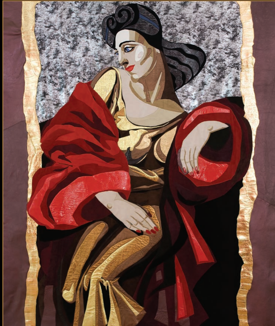
Red Lady, 1 150 x b 130 cm, tableau van leer, Fong Leng

Gerti Bierenbroodspot en Fong Leng : Femmes Fatales