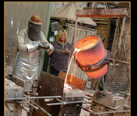
Bronsgieten bij Custers