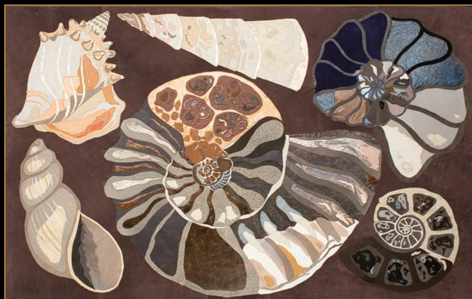
Fossils in the deep purple sea, 1 295 x b 195 cm, tableau van leer, Fong Leng

In maart 2008 opent een unieke tentoonstelling; ook weer gelijk lopend met de TEFAF kunstbeurs: twee kunstenaars gaan samen in een harmonieus en ook in een heel verschillend materiaal. Grote bronzen torsen en koppen van Gerti Bierenbroodspot en de nieuwste 'tableaus' van Fong Leng gemaakt van leer.