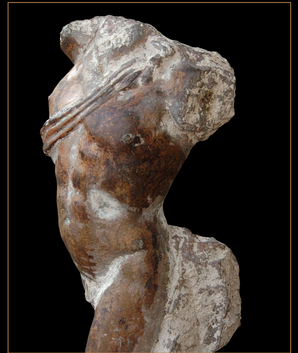
Nereïde, h 90 x b 40 x d 30 cm, brons, Gerti Bierenbroodspot