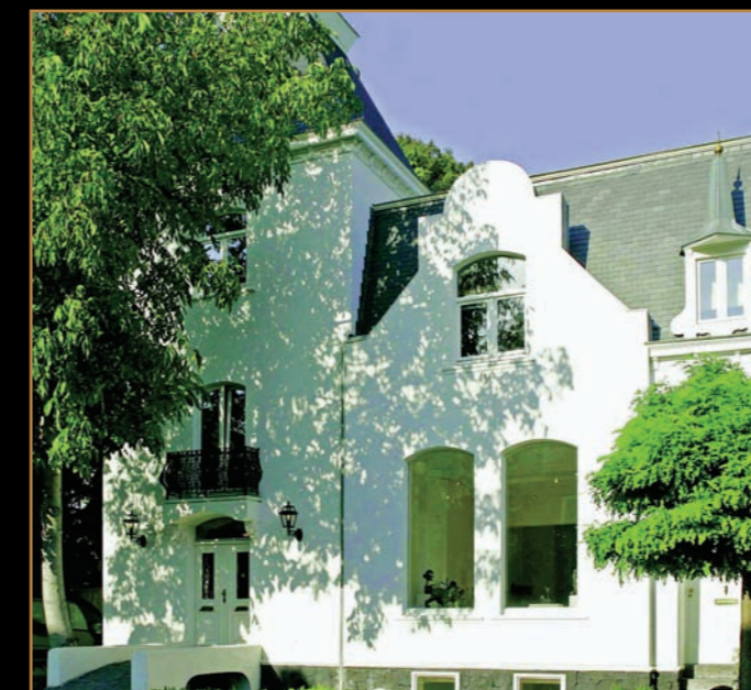
Gallery Bell'Arte in Maastricht

Zondag 9 maart is de opening van de unieke expositie 'Femmes Fatales'. De Preview is op 7 en 8 maart. De expositie duurt tot en met 18 mei.