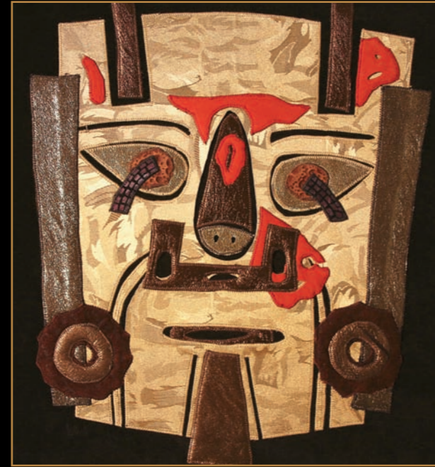
Masker, 1 150 x b 40 cm, tableau van leer, Fong Leng