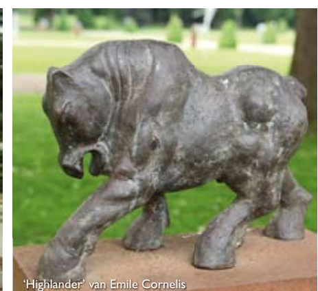
'Highlander' van Emile Cornelis