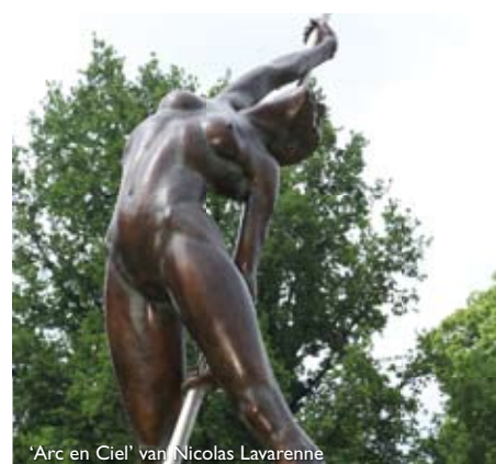
'Arc en Ciel' van Nicolas Lavarenne