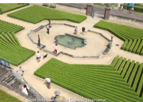
Overzicht beeldentuin Château Neercanne